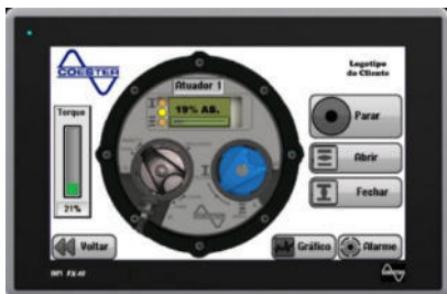
HMI para control Portátil hasta 30 actuadores