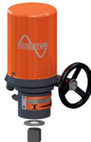
Actuador Estándar acople directo